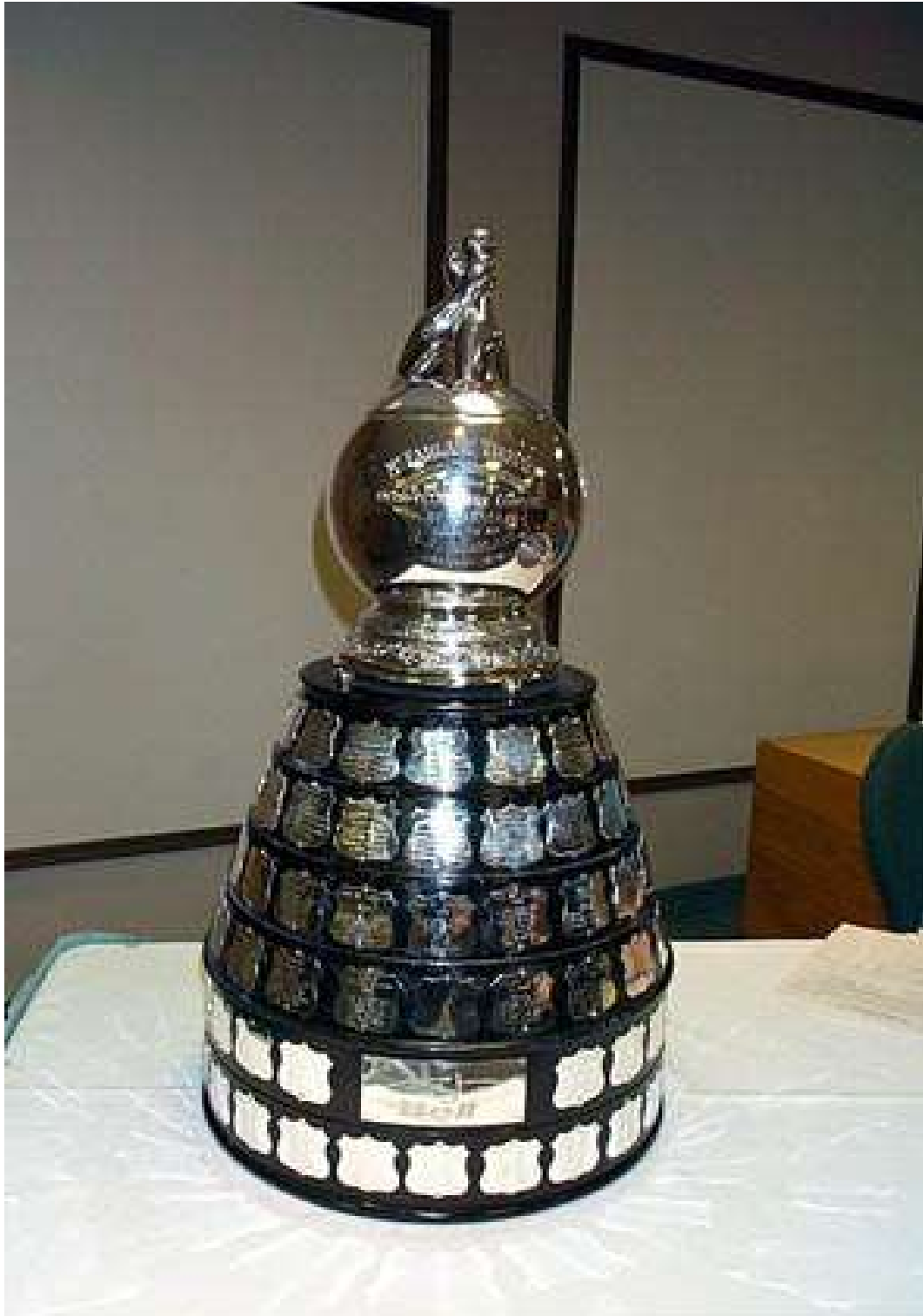
Le Trophée de Quilles McFarlane